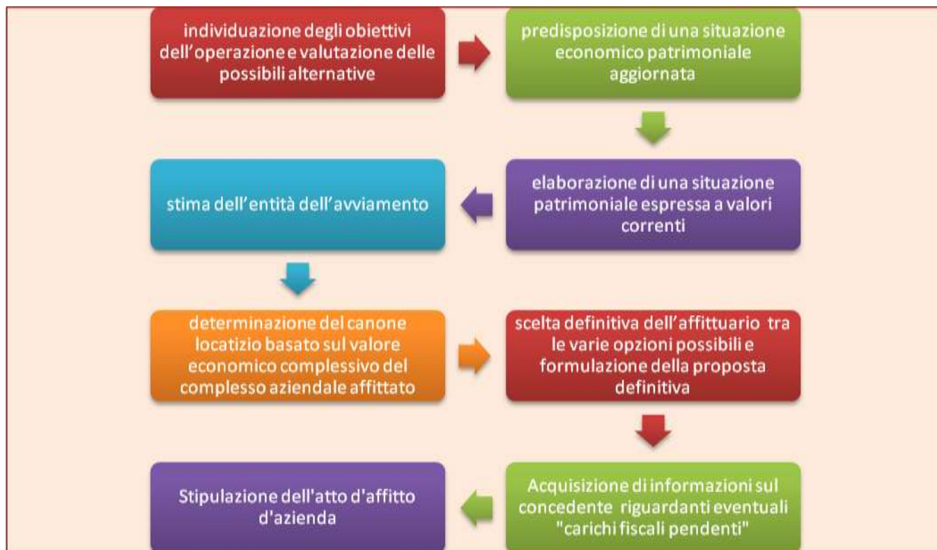
Fig. 1: Schema dell'iter procedurale dell'affitto d'azienda

L'iter procedurale da seguire può essere graficamente così schematizzato: